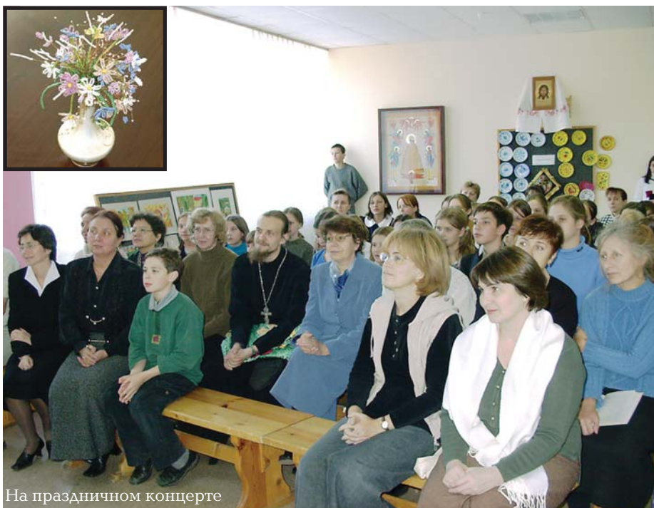
На праздничном концерте