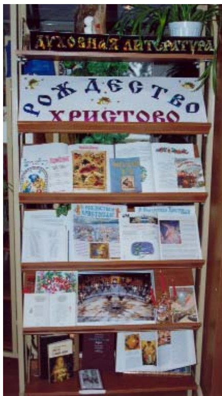
В январе было подготовлено шесть книжных выставок!