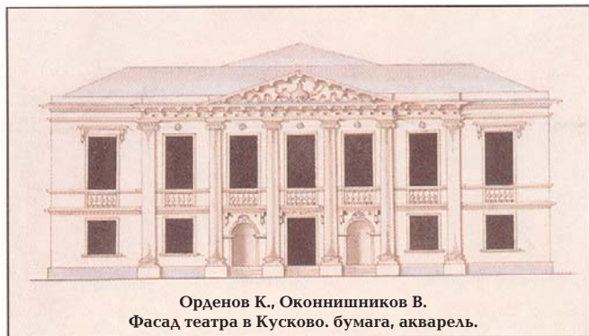
Орден К., Оконишников В. Фасад театра в Кусково. бумага, акварель.