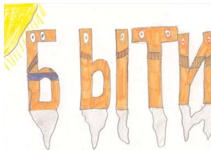
Рис. Р. Бекшенева

Жил был глагол и звали его Быти. Но это был совсем неизвестный глагол. В то же время жил глагол to Be. Это был очень известный глагол. Его всегда употребляли в английской речи.