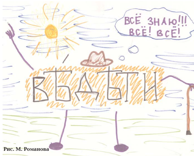
Рис. М. Романова