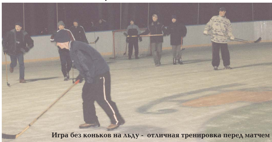
Игра без коньков на льду - отличная тренировка перед матчем

Первого февраля в субботу в 20:00 на катке состоялся товарищеский матч по хоккею между сборной командой школы «Упрямые утки» и командой воспитателей «Могучие викинги».