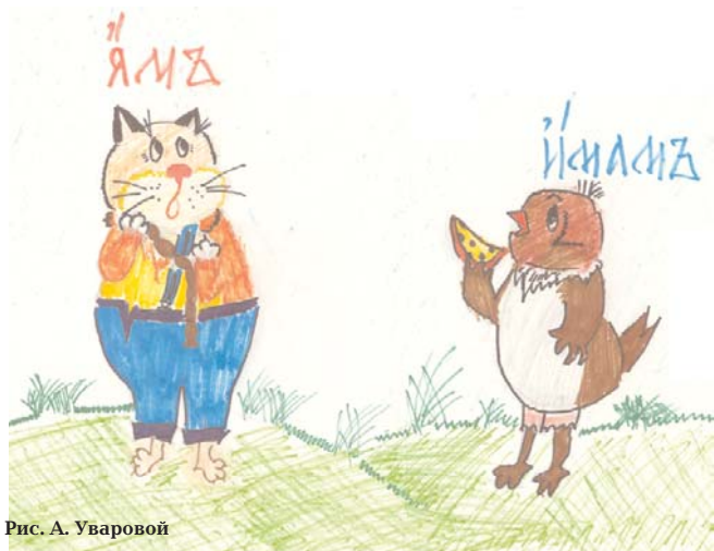
Рис. А. Уваровой

Было это неизвестно где, неизвестно когда, но встретились на перекрестке дорог четыре смешных человечка. Одного звали Есмь, другого Есва, третьего Есмы, а четвертой была девушка по имени Есва.