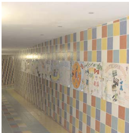
Плесковские спортивные газеты