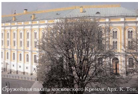
Оружейная палата московского Кремля. Арх. К. Тон.

В Оружейной палате выставлены также все шапки