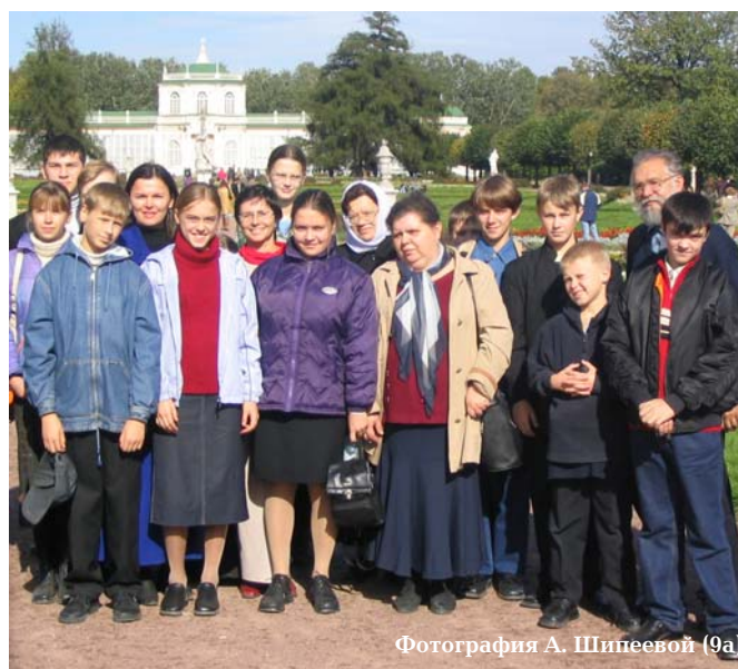
Фотография А. Шипеевой (9а)

В первые школьные дни ребята успели побывать в Спасо-Бородинском монастыре, Бородинском музее-заповеднике, на театрализованном сражении (см. стр. 2), изучить усадьбу «Кусково» (см. стр. 2), в театре «Камерная сцена» посмотреть спектакль «Царь, Федор Иоаннович» (см. стр. 3)