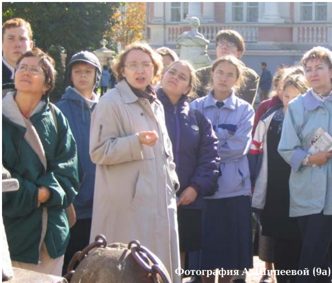
Фотография А. Шипеевой (9а)

тей. Во дворце очень много картин: портретов русских и иностранных правителей, пейзажей.