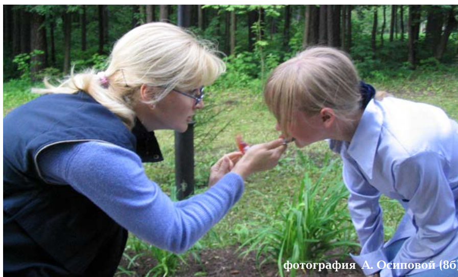
фотография А. Осиповой (8б)