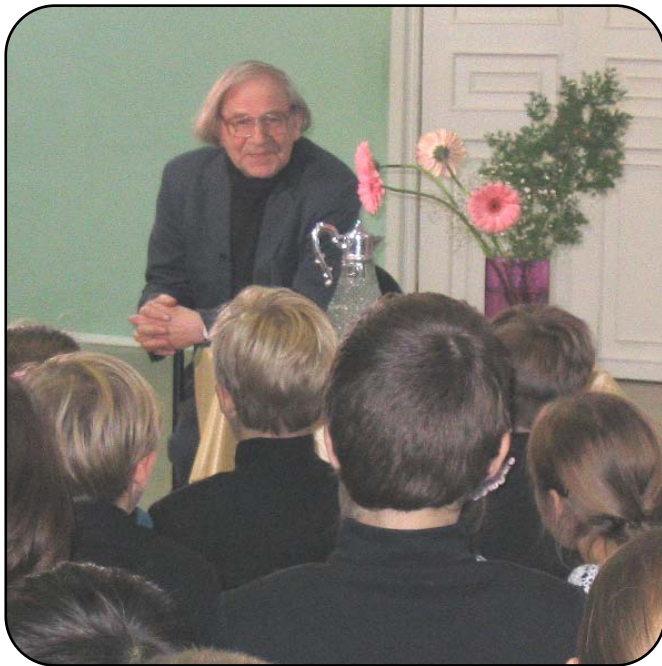
В начале октября в Плёсково гостил известный правос- лавный писатель Борис Александрович Ганаго . Перед отъ- ездом автор поделился своими впечатлениями. (см. стр. 3)