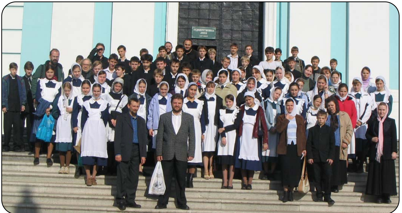
3 октября, накануне нашего престольного праздника учащиеся старших классов, преподаватели и воспитатели совершили традиционную поездку в Троице-Сергиеву лавру. (Погробней см. стр. 2)