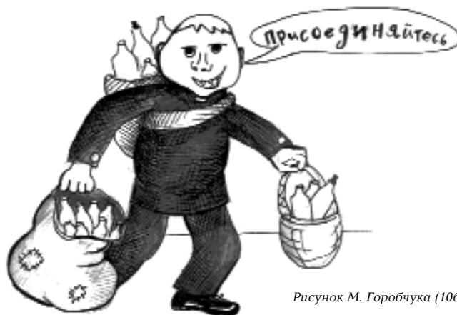
Рисунок М. Горбчука (10б)

Так как наша школа для каждого является вторым домом, то преобразования, направленные на развитие Плесково, нам кажутся, важны всем. Поэтому надеемся на помощь всех плесковцев и будем рады видеть вас в наших рядах.