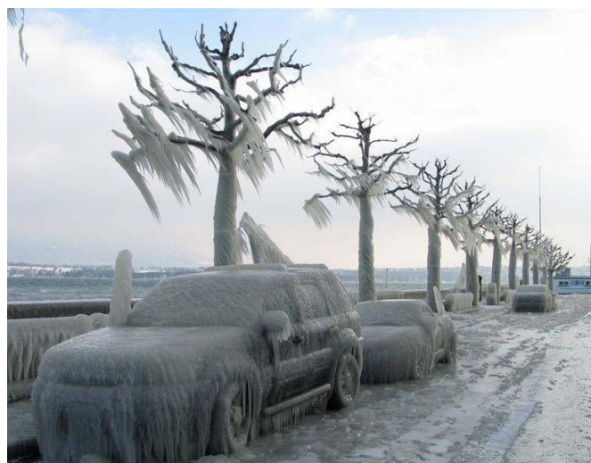
Подборка материалов Е. Вострикова (8б)

Через сто лет тоже 5 февраля полярное сияние было отмечено на Украине.