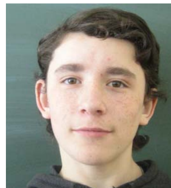
Мануйленко Павел — лауреат Нобелевской премии в области прикладного искусства