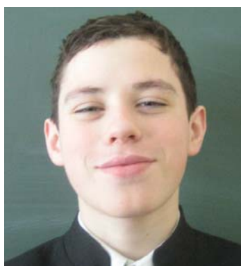
Кочетов Игорь — историк с мировым именем