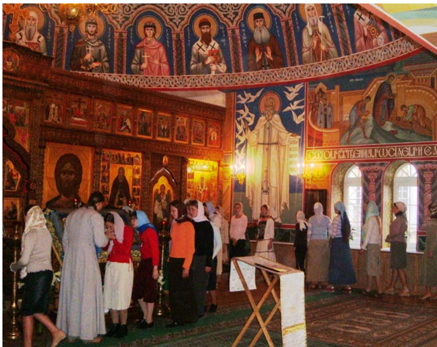
Главным подарком всем-всем плесковцам стали новые росписи нашего храма Подробнее в следующем номере газеты.