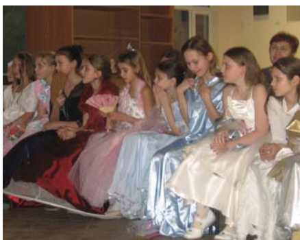
Сказка — ложь, да в ней намек, добрым молодцам урок...