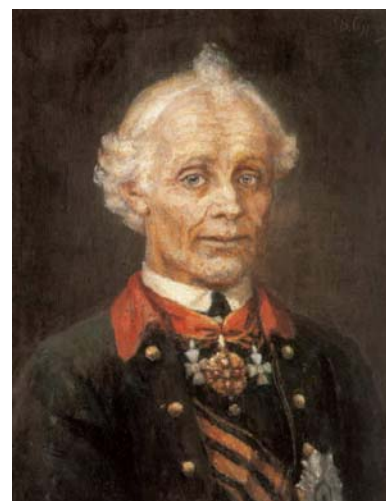
Суворов А. В. Генералиссимус

Изображен генералиссимус А. В. Суворов – знаменитый полководец России XVIII в. С ним связано много блистательных побед и огромный подъем военной славы России.