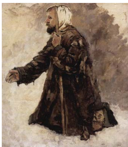
Юродивый на коленях

Изображен юродивый, стоящий на коленях. Возможно, это Василий Блаженный – знаменитый юродивый XVI в.