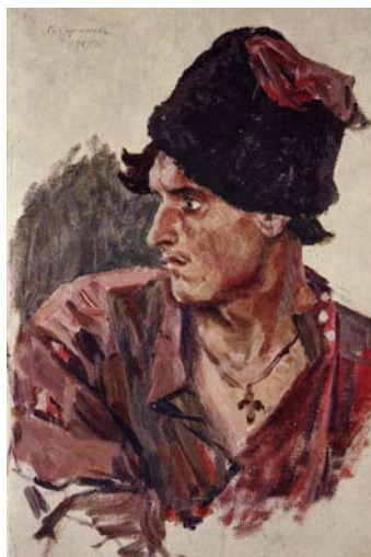
Голова молодого казака

Изображен молодой казак. В лице тревога, фон красный. Война, наверно.