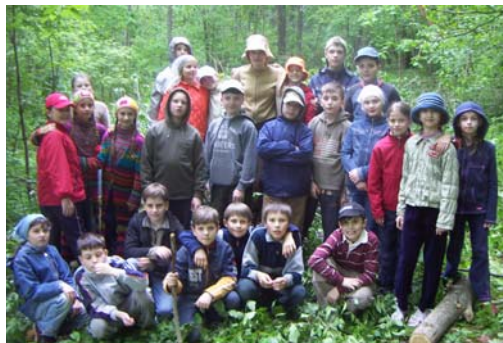
На благоустройстве родника