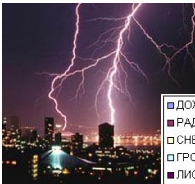
Любимые природные явления (ученики)

В список кулинарных пристрастий вошли кухни, наверное, всех народов мира. Пицца, пельмени, суши, плов, картошка с мясом, борщ, мясо по-французски, но преобладает все-таки русская. А один ответ глубоко затронул душу: любимая кухня — плесковская!