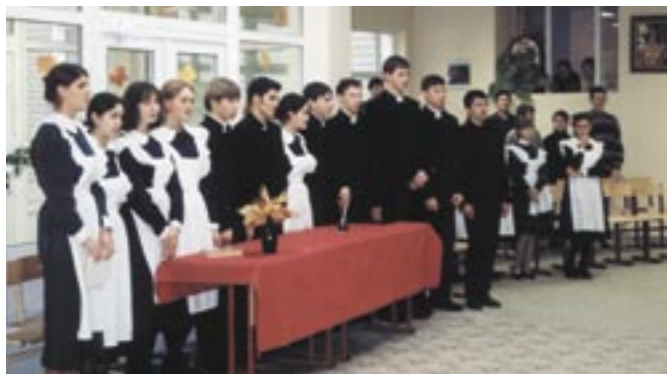
«Gaudeamus igitur...».