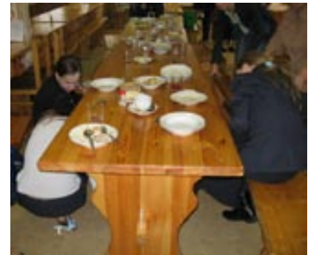
Фото И. Блинова (9)