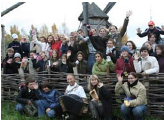
В Марийском Этнографическом музее под открытым небом.

Как трудно выдержать 14 часов в автобусе, но мы это пережили и 12 октября в 4 утра уже были в провинциальном городке Козьмодемьянске, который находится в 700 км от Москвы. Рано утром приехав в гостиницу, мы немного отдохнули, а потом пошли в городскую администрацию встречаться с мэром. Мэру мы рассказали свои планы по изучению города, задали ему вопросы. Потом поехали в этнографический музей под открытым небом, откуда разошлись уже командами по шесть человек из разных школ для выполнения поставленных задач. Заданий было 10, все они были очень интересными. Например: купить на семь рублей как можно больше съедобных товаров, залезть на двухметровый памятник «12 стульям», нарисовать мелками на площади Ленина фигуру сеятеля, как её изобразил Остап Бендер. Все эти задания были связаны с романом «12 стульев» И. Ильфа и Е. Петрова.