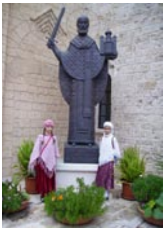
Памятник св. Николаю в г. Бари

Самое главное — мы побывали на литургии, которую служили наши российские священники у мощей святого Николая Мирликийского, и причастились. Побывали мы и в храме Русской православной миссии в г. Бари, где заказали требы. А потом, после акафиста Николаю Чудотворцу... потерялась наша мама! Мы чудом с ней встретились уже на пароме.