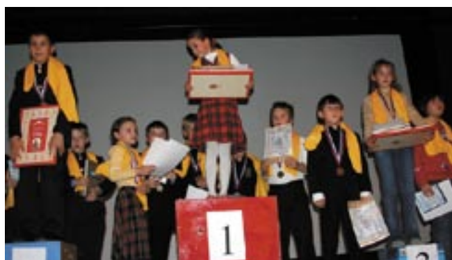
Команды-победители олимпиады

28 ноября в нашей школе прошел финал Открытой интеллектуальной олимпиады «Наше наследие» среди учащихся начальных классов из 17 православных школ г. Москвы, Московской области, г. Калуги и г. Переславля-Залесского.