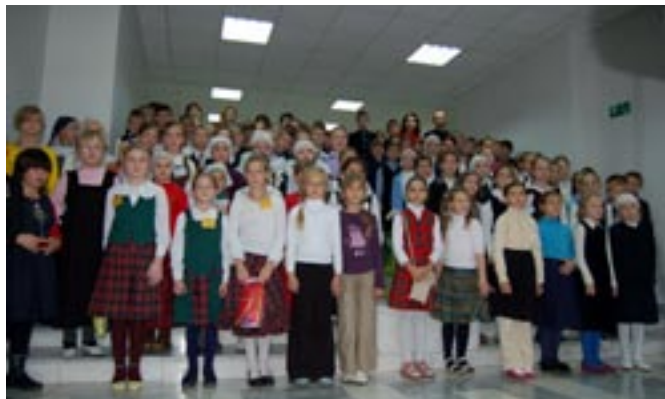
Участники финала интеллектуальной олимпиады «Наше наследие» в начальной школе.