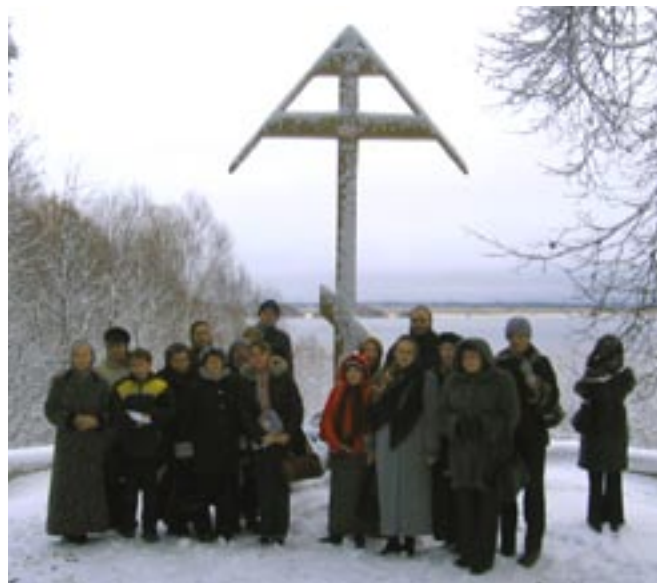
Перынский скит. Поклонный крест на берегу о. Ильмень.

На небольшом живописном полуострове Перынь, на высоком холме, находится Перынский Рождества Богородицы скит. В дохристианское время здесь находилось капище бога Перуна. В 988 г. после крещения Великого Новгорода по велению князя Владимира деревянная статуя Перуна была сброшена в Волхов. Церковь Рождества Богородицы — один