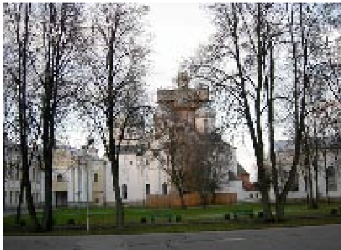
Новгородский кремль. Вид на Софийский собор

В первый же день мы побывали в новгородском Кремле, называемом Детинцем. Он заложен еще при Ярославе Мудром в 1044 г. А мощные крепостные стены и высокие башни возводились при Иване III.