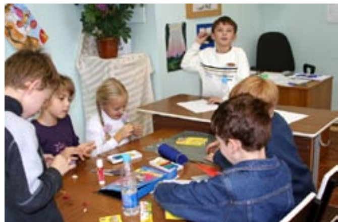
За работой — конкурс поделок.

Одной из составляющих олимпиады был конкурс поделок, в котором нужно было смастерить домик (из пластика, цветного картона, клея и т. п.) для одного из героев сказки «Теремок» и сочинить сказку (историю), о том, как он оказался в этом домике.