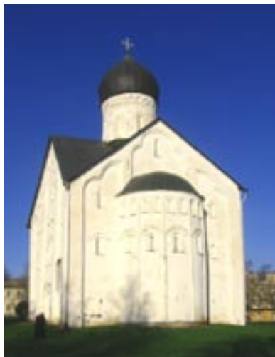
Церковь Спаса Преображения на Ильине улице, где сохранились знаменитые фрески Феофана Грека.

Конечно, невозможно осмотреть все храмы Торговой стороны. Но нам очень повезло, что для дальнейшего знакомства с архитектурными памятниками Великого Новгорода были выбраны церковь Спаса Преображения на Ильине улице (1374 г.) и Знаменский собор (1688 г.)