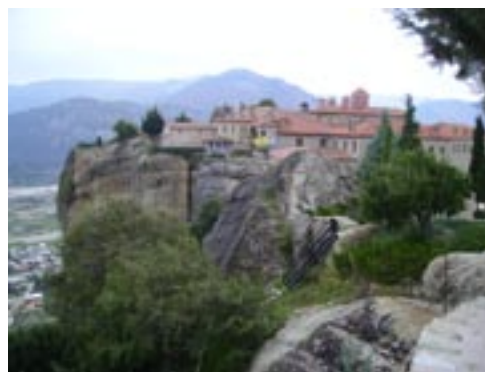
Монастырь св. Стефана в Метеорах

Пожалуй, одно из самых незабываемых впечатлений — это