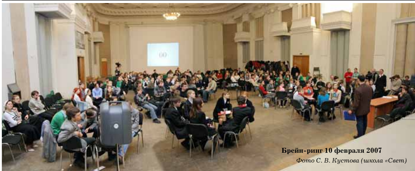
Брейн-ринг 10 февраля 2007