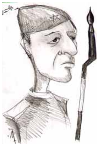
Рис. М. Горобчука

Запомнилась совместная служба с офицерами, знавшими Юрия Гагарина и запустившими спутники, встречи с космонавтом Германом Титовым, строительство спортивного городка, общение с товарищами, служба в штабе.