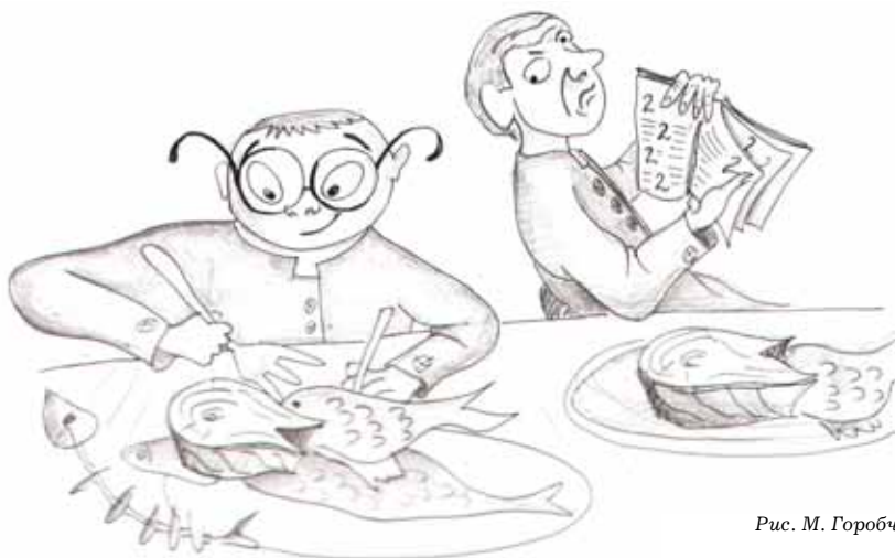
Рис. М. Горобчука

Уже в издательстве ученики бв обсудили эту ситуацию и решили, что материал о рыбе мог бы получиться не только полезным, но и познавательным. Тем более, на дворе Великий пост, и со второй недели в трапезной ожидаются рыбные блюда, причем в больших количествах. Поэтому, если отказаться от рыбы, можно остаться голодным. А стоит ли отказываться? Чтобы изучить «рыбный» вопрос со всех сторон, мы обратились за комментариями к экспертам, сделали мини-опрос и таким образом получили много полезной информации. Надеемся, что наше журналистское расследование поможет кому-то не только иначе взглянуть на рыбные блюда, но главное — полюбить их.