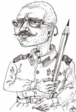
Рис. В. В. Аксенова