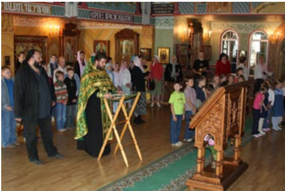
Как и всякое большое дело, слет новичков в Плескове начался с молебна

Первый день в Плескове был очень насыщенным, свободного времени почти не было. Наверное, так и должно быть. А «Тропа доверия» помогла нашей команде сплотиться.