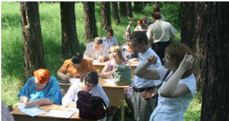
30 мая — день тестирования новичков. Родители заполняют анкеты в Шереметевской аллее

Я волновался перед экзаменом. Я волновался, когда сдавал экзамены. Я волновался даже во время собеседования. Потому что мне очень хотелось поступить в эту школу.