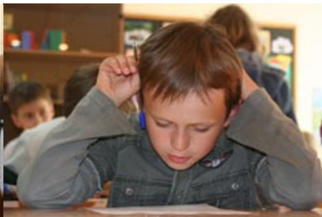
7 июня на анкеты участников летнего слета новичков отвечали и родители, и дети..