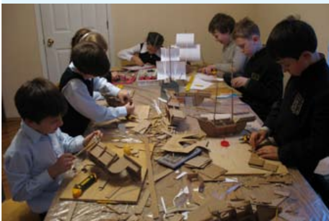
Кипит работа на плесковской верфи

Готовясь к празднику Святителя Николая архиепископа Мирликийского, мы с ребятами из кружка декоративно-прикладного искусства выбрали для поделок сюжет спасения святителем Николаем путников, плывущих на корабле из Египта в Ликийскую страну, от бури и морского волнения. В качестве материала для творческой работы мы выбрали упаковочный картон, ватман и клей ПВА.