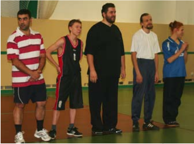
Опыт и сила