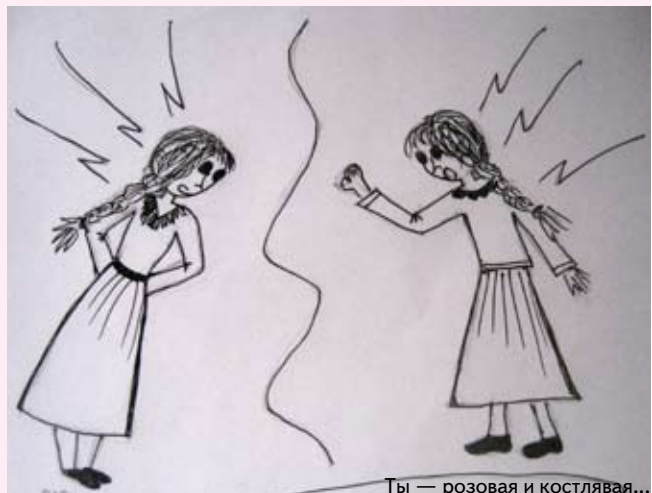
Ты — розовая и костлявая...