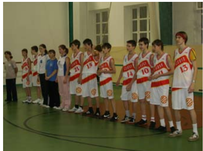
Молодость и многочисленность

И вот игра подходит к концу, а наша команда не приближается к победе, а все дальше отдалается от нее. Хотя поначалу казалось, что вот чуть-чуть осталось и мы одолеем «Сотников»!