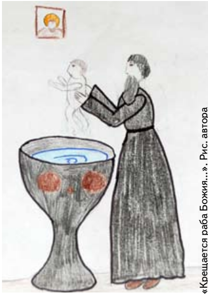
«Крещается раба Божия...». Рис. автора

Моя бабушка появилась на свет в первый день 1946 года.