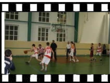
Баскетбольный матч: «Скимен» — «Сотники»

славной культуры «Русь Святая, храни веру Православную»