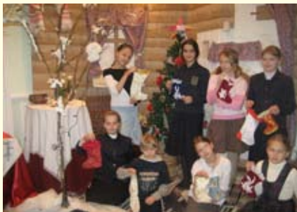
Сапожки уже готовы...

Любая творческая работа всегда прекрасна и интересна, когда она соборна. Конечно, каждый ребенок, несомненно, талантлив и может достичь результатов, когда делает свою работу индивидуально, но работа сообща не только обогащает ребенка творчески, но дает чувство солидарности, сплоченности, так недостающее в наше время. Выставки получают разноплановыми и всегда привлекают внимание. Первая совместная выставка «Золотая осень» прошла в октябре. Она была интересна, дети работали вместе с родителями. В кружке были даны основные приемы декоративно-прикладного творчества, но они были доработаны дома сообща с родителями. Родители не только привнесли