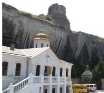
Свято-Климентовский монастырь в Крыму