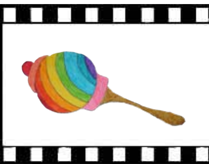
Знакомьтесь: маленькие богословы из «Плесково»