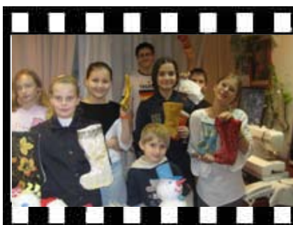
Подготовка к празднику Святителя Николая