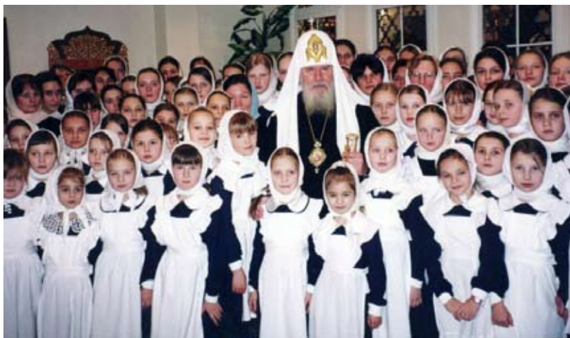
Ноябрь 2001. Приезд Святейшего Патриарха Алексия II в «Плесково»

5 декабря 2008 г. скончался Святейший Патриарх Московский и всея Руси Алексий II