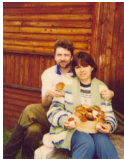
На даче с мужем

На 5-м курсе на практику мы поехали в глухую деревню. Мне достался 5 класс, в котором были 4 мальчика и 1 девочка. Математик сбежал от них в город за месяц до того, а мне с ними было так интересно и весело. Через 5 дней после начала моей педагогической деятельности при проверке тетрадей нахожу записку: «Светлана В., приходите сегодня за деревню кататься с горки. 5 класс». Ура! Признали!