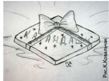
Рис. К. Ковальчак

Я хочу рассказать об одном чуде, связанном с моей мамой.