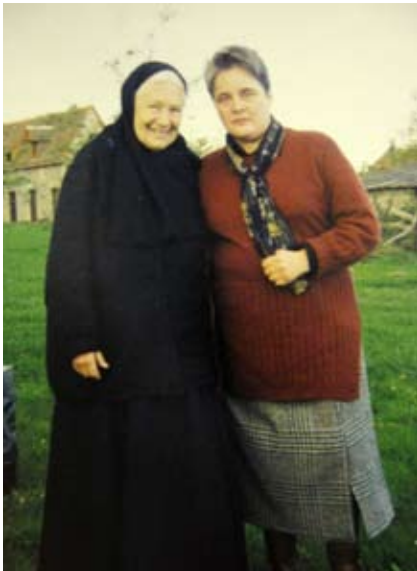
С насельницей обители

Утром из Парижа я позвонила в монастырь. Автоответчик сказал, что трубку телефона берут с 12.00 до 13.00. Все интересующие вопросы надо выяснять только в