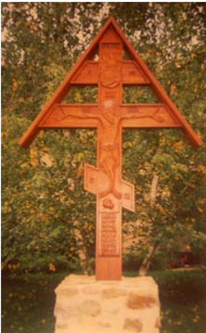
Поклонный крест, все надписи сделаны по-церковнославянски