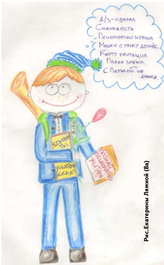
Рис. Екатерины Лямной (8а)