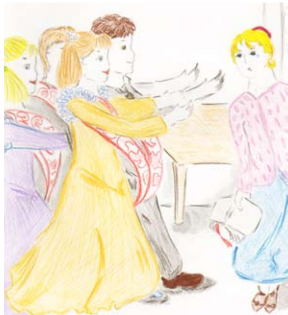
Рис. Екатерины Ляльченко (8а)