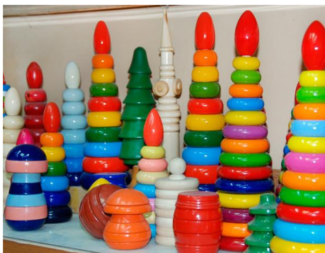
Пирамиды, бочата, грибочки

Деревянные игрушки становятся всё популярнее, у них есть много преимуществ: 1. Развивают мелкую моторику рук, речи, координацию движений, творческого мышления; 2. К деревянным игрушкам относятся бережно; 3. Эти игрушки многофункциональны и дают проявить ловкость рук, смекалку, фантазию, логику; 4. Деревянные игрушки прочные и более безопасны для здоровья детей, особенно для аллергиков и менее вредны для окружающей среды, это лучшая альтернатива пластиковым игрушкам.