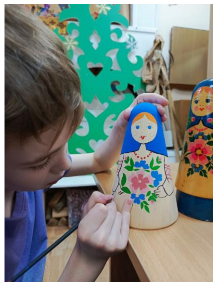
Расписываю свою матрёшку