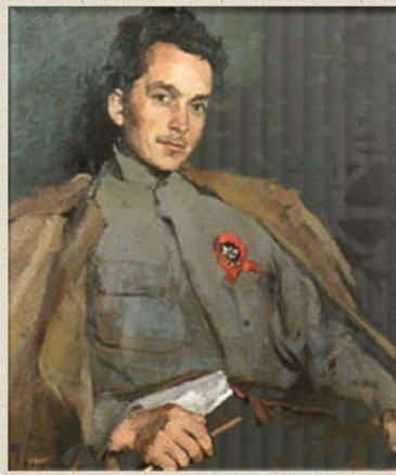
Художник Сергей Малютин