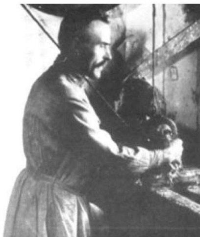
Белая заготовка (бельё)