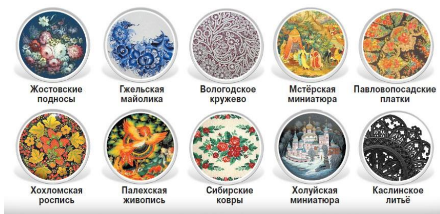
Русские народные промыслы

Сегодня почти в каждой семье есть произведения народных мастеров – русские матрёшки, гжельская посуда, хохломские миски и ложки, павлопосадские платки, тканые полотенца и т.д.