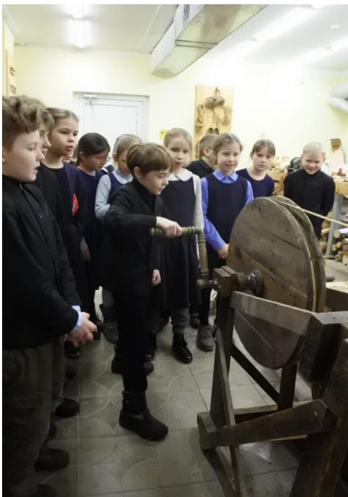
Кручу ручной станок