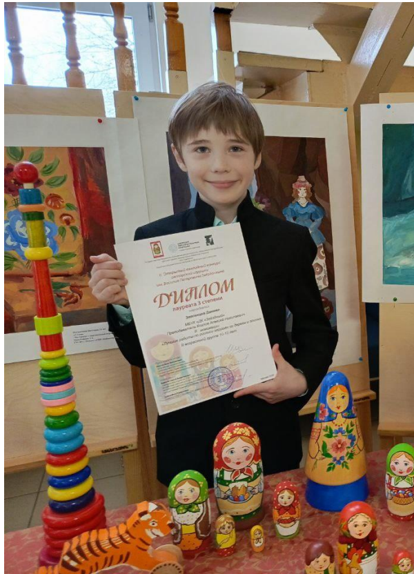
Я на вручении диплома за участие в конкурсе